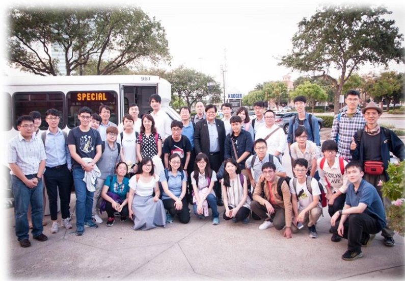
MDACC洪明奇院士與赴美參訪師生合影