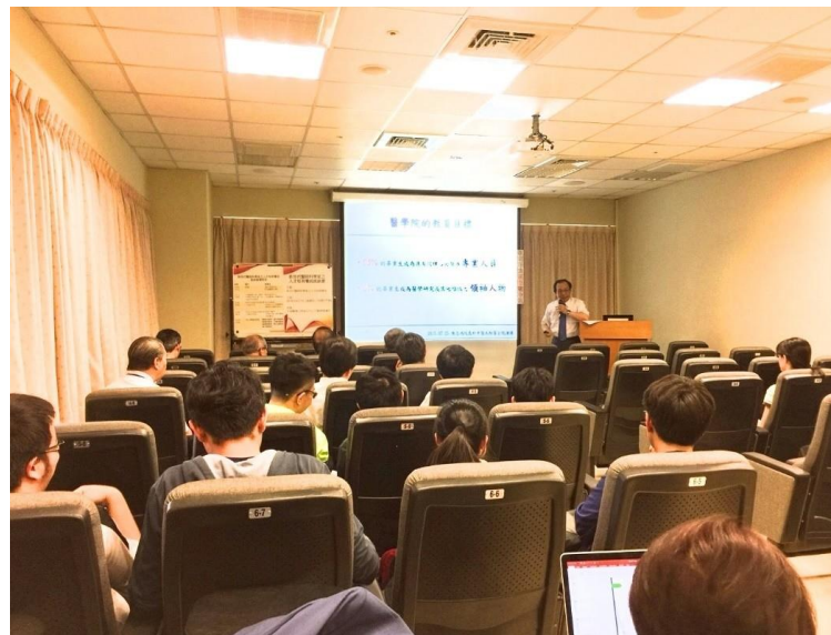
世代醫師科學家之人才培育養成 座談會：邀請我校國內外 MD/PhD校友學者分享