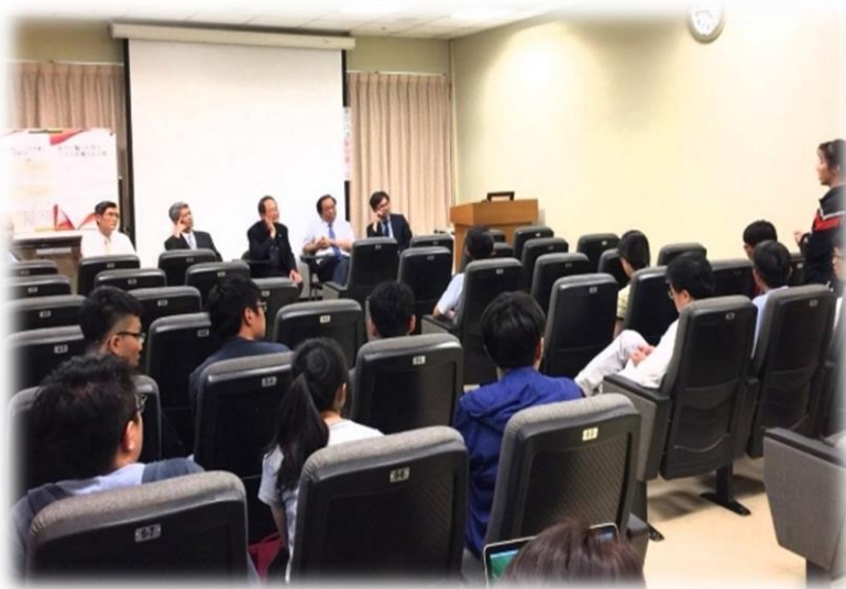
中國醫藥大學醫學系校友與學 程學生進行QA互動分享